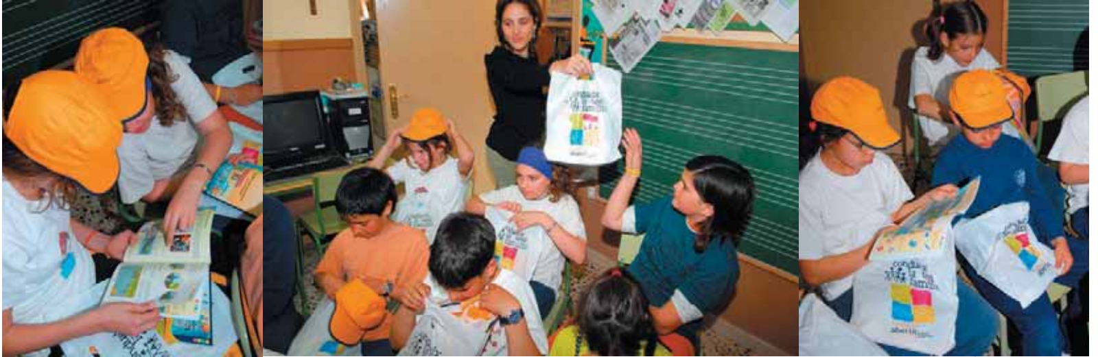
Nens i nenes consulten les noves eines que els formaran en seguretat viària.

sorat, per a l'alumnat i per a les famílies. Els estudiants reben la Guia d'Educació Viària per a la Família i un joc didàctic, amb la participació del professorat, i a partir del desenvolupament de les fitxes didàctiques els alumnes poden obtenir la Targeta de Conductor Familiar.